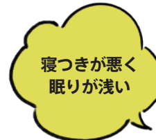
気温差による自律神経の乱れで体がリラックスできず、睡眠の質が低下している可能性があります