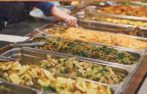
目の前に並ぶ食材を選ぶのも、楽しみのひとつ

お惣菜を前に「どれにしよう?」と迷うのも楽しい時間。中でも一番人気は、大きくてジューシーな唐揚げ。自分好みの組み合わせで作る定食は、お腹も心も満たしてくれます。 食後は併設の物産館も要チェック。霧島の農家さんが育てた採れたて野菜や、昔ながらの製法で作られた調味料、手作りのお惣菜などが所狭しと並びます。旅のお土産にはもちろん、夕飯のプラス一品など普段使いにもぴったり。霧島の「おいしい逸品」を持ち帰ってみませんか。