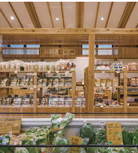
新鮮な野菜や地元の加工品、鹿児島ならではの特産品が豊富

「西郷どんの宿」で歴史散策を楽しんだ後は、敷地内にあるレストラン「日当山無垢食堂」と物産館へ。ここは霧島の「食」の豊かさを五感で楽しめるスポットです。 地元客も多く訪れる、レストラン「日当山無垢食堂」のランチは、体に嬉しい「汁三菜」スタイル。その日の気分に合わせて献立をカスタマイズできるのも、嬉しいポイント。メイン料理は3種類から、副菜も数種類ある中から好きなものを選びます。ずらりと並んだ