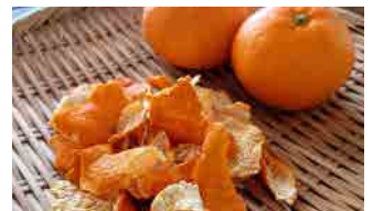
柑橘類の皮を耐熱皿に乗せ、少し熱を加えて