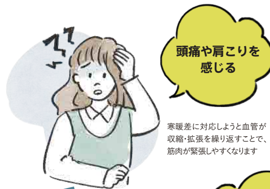
寒暖差に対応しようと血管が収縮・拡張を繰り返すことで、筋肉が緊張しやすくなります