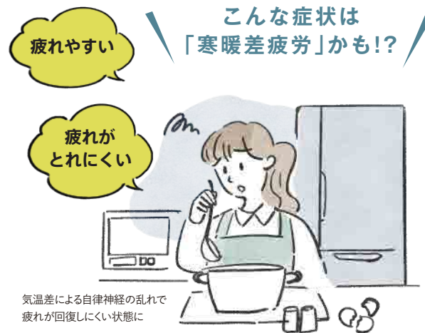
気温差による自律神経の乱れで疲れが回復しにくい状態に

この時期、何となく調子が上がらない……と感じることはありませんか？ それはあなたの問題ではなく、この季節特有の「寒暖差」が関係しているかもしれません。 季節の変化に負けない健康な体を保つための役立つ情報をお届けします。