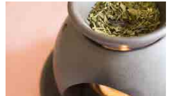
緑茶・ほうじ茶を茶香炉(ちゃこうろ)で