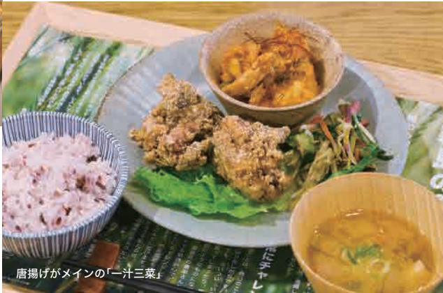
唐揚げがメインの「汁三菜」