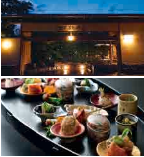
日本一の鹿児島黒などを使用した懐石料理

明治の英雄たちも愛した名湯と日本庭園に癒やされる 鹿児島県・霧島市に佇む日当山温泉は、800年以上の歴史を誇る名湯。西郷隆盛や坂本龍馬などの明治維新の英雄に愛されたとも言われる温泉地です。 「数寄の宿野鶴亭」は、情緒あふれる日本庭園と源泉かけ流しの湯を心ゆくまで堪能できる、贅沢な空間が特徴の温泉宿です。地下深くから汲み上げられる源泉は、とろりとした肌触りで「美人の湯」としても知られる弱アルカリ炭酸水素塩温泉。庭園と一体となった大浴場では、昼は木漏れ日の中で、夜は幻想的な灯りと星空を眺めながら。歴史ある名湯と数寄屋造りの静かな空間が心身共に喧騒からそつと解き放してくれます。