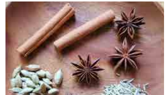
シナモン・クローブを軽く砕いて置いておく