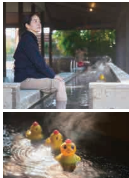
日当山西郷どん村 ひなたやませごんむら 鹿児島県霧島市隼人町内1487-1 TEL0995-42-5880 営業時間/9:00~17:30 入場料無料 西郷どんの宿、足湯休業日/年末年始

多くの温泉地を愛したことで知られる西郷隆盛。日当山温泉を訪れた際、たびたび滞在したとされる「龍宝家」を資料に基づき忠実に復元したのが、「西郷どんの宿」です。畳の間に座わり日本庭園を眺めていると、まるで幕末にタイムスリップしたような情景を感じることができるのが「西郷どんの宿」の最大の魅力です。宿のすぐそばには無料で利用できる足湯があり、気軽に温泉気分を味わえます。